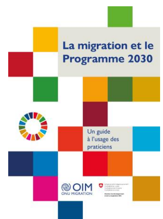
Publication : La migration et le programme 2030