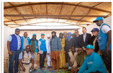
Visite du camp de réfugiés M'bera par l'Ambassadeur des Etats-Unis en Mauritanie. Lire plus